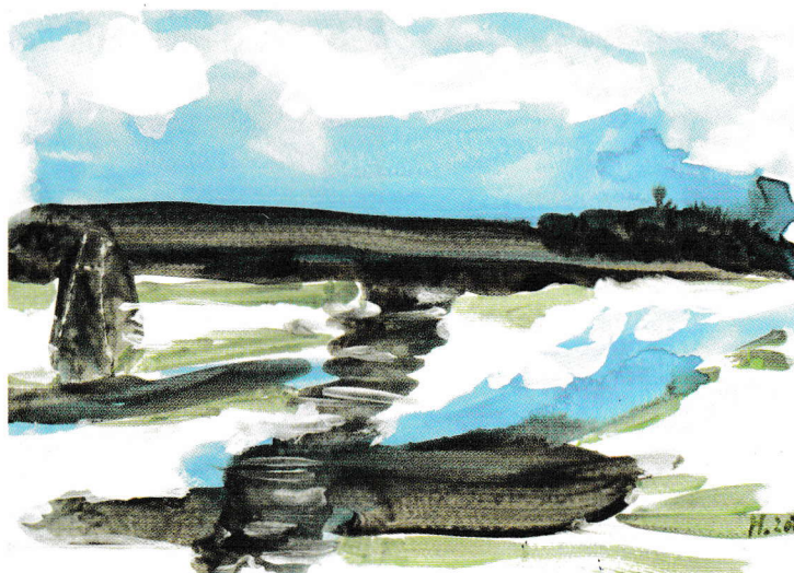
Villi Hermann "Venezia", 3.5.2022

La mostra di opere di Villi Hermann è stata inaugurata lo scorso 22 marzo alla presenza dell'artista e con una presentazione di Dalmazio Ambrosioni. Si può visionare gratuitamente rimane fino al 22 aprile allo Spazio espositivo La Cornice (a Lugano centro, via Giacometti 1); ampio l'orario d'apertura: nei giorni da lunedì a venerdì 8.00-12.00 e 14.00-18.30, sabato dalle 9.00 alle 12.00. Una buona parte della mostra è sempre visibile dall'esterno, nelle due ampie vetrine della galleria.